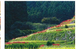
星野村 鹿里彼岸花