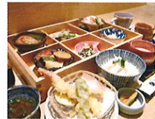
季ごころくぼやま