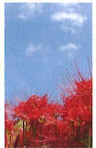
星野村 鹿里彼岸花