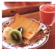
パノラマCafeとびかたの森

春の訪れを知らせてくれる梅の花。約3万本の白梅の香りに誘われて立花町の自然をお楽しみください。トンネル内の「竹あかり幻想の世界」も必見です。