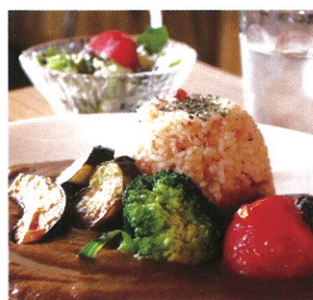
パノラマCafeとびかたの森