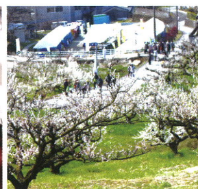
夢たちばな観梅会