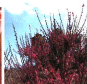
夢たちばな観梅会